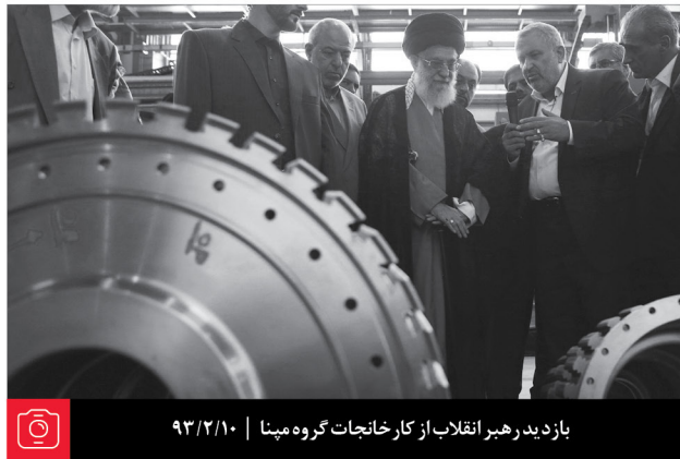
بازدید رهبر انقلاب از کارخانجات گروه مینا | ۹۳/۲/۱۰